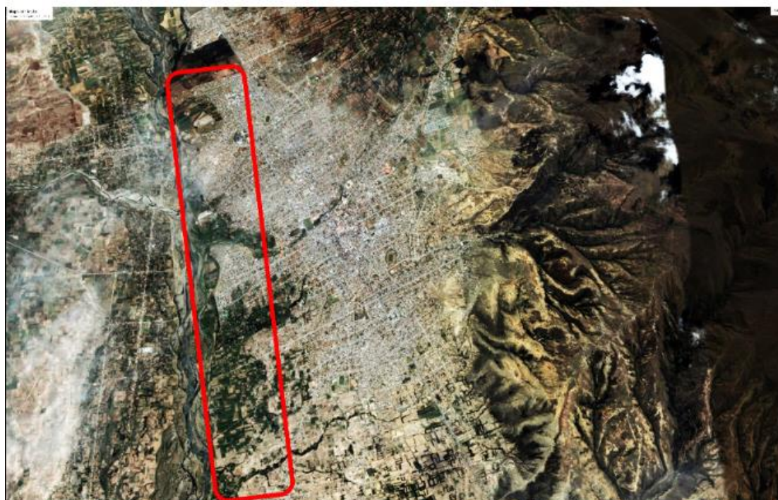
FIGURA 5. Imagen satelital de la ciudad de Huancayo, año 2006

Estos cambios por expansión urbana se muestran en las áreas periféricas de la ciudad de Huancayo, ya sea en las zonas netamente agrícolas o cercanas al río (como mencionamos en párrafos anteriores), siendo también un factor determinante el precio de los terrenos y las crecientes demandas para urbanizarse mediante la creación de condominios y residenciales. La pérdida de terrenos agrícolas va a generar escasez de producción agrícola para el mercado local, existiendo la necesidad de apertura o de fortalecimiento de los mercados existentes como Yauyos.