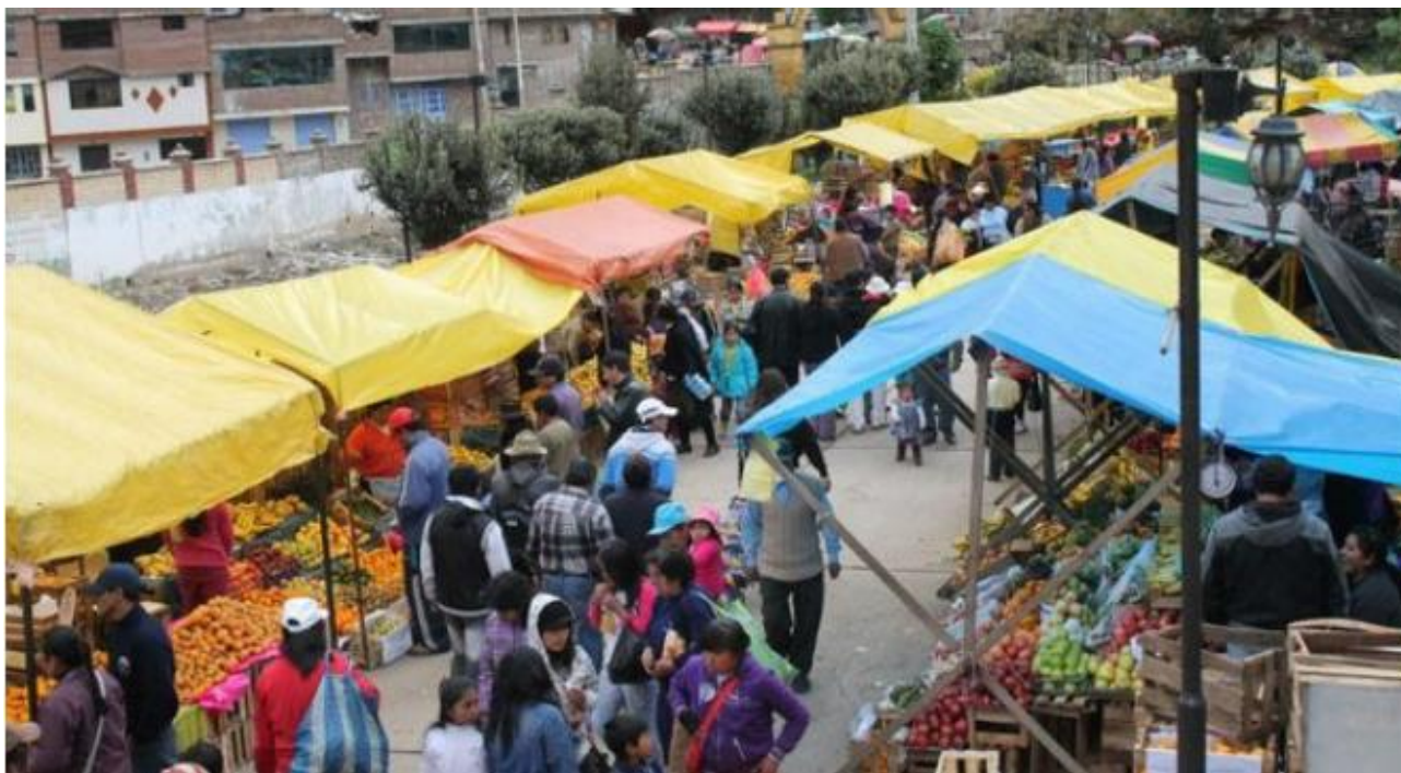
FIGURA 2. Feria dominical tradicional de la ciudad de Huancayo