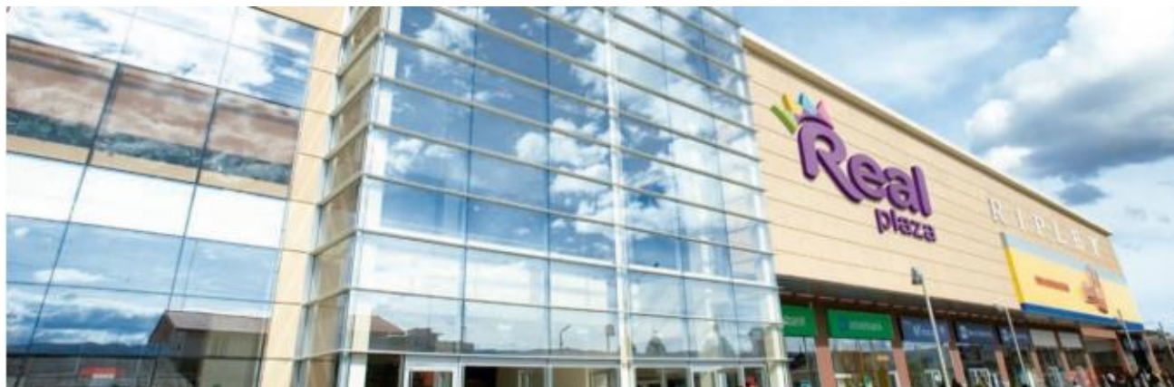
FIGURA 8. Centro Comercial Real Plaza Huancayo