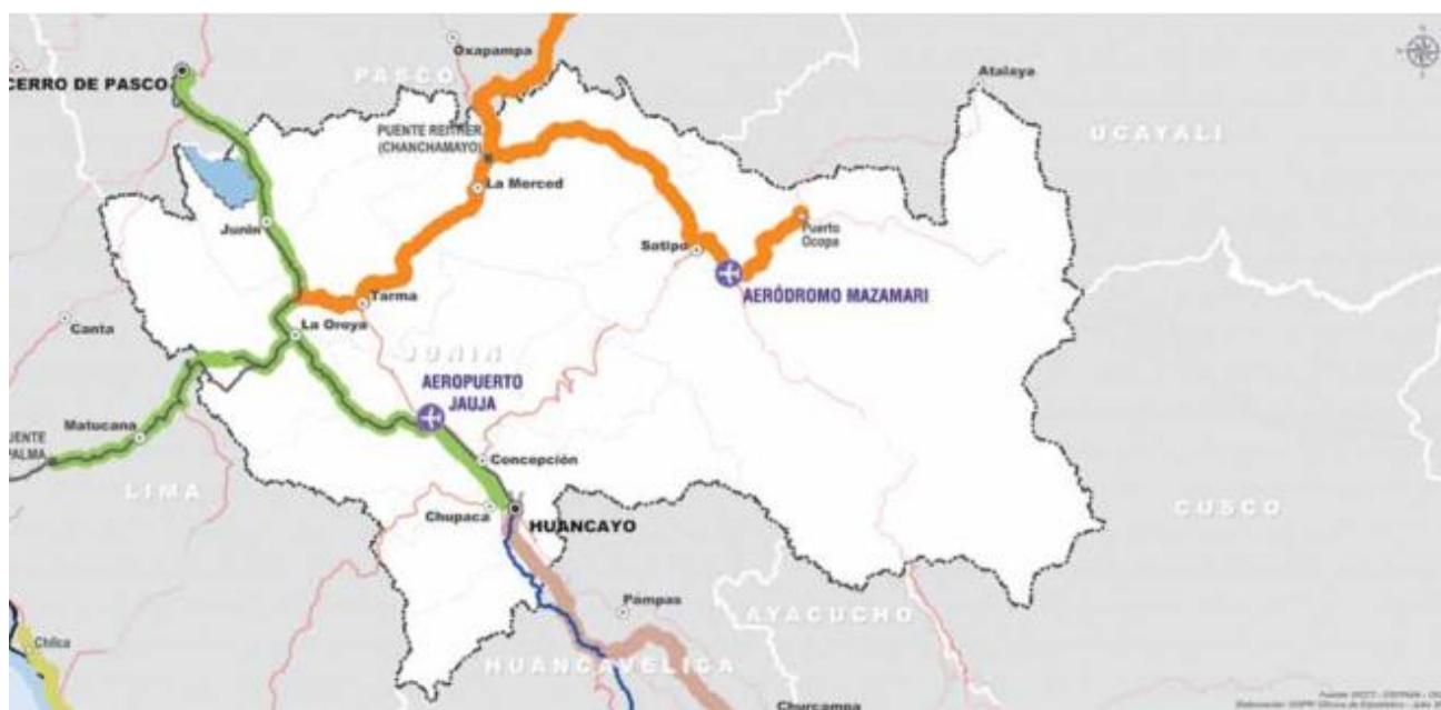
FIGURA 3. Sistema de redes de la región Junín, año 2015