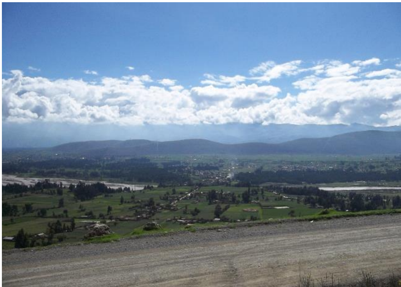
FIGURA 7. Imagen panorámica del Valle del Mantaro