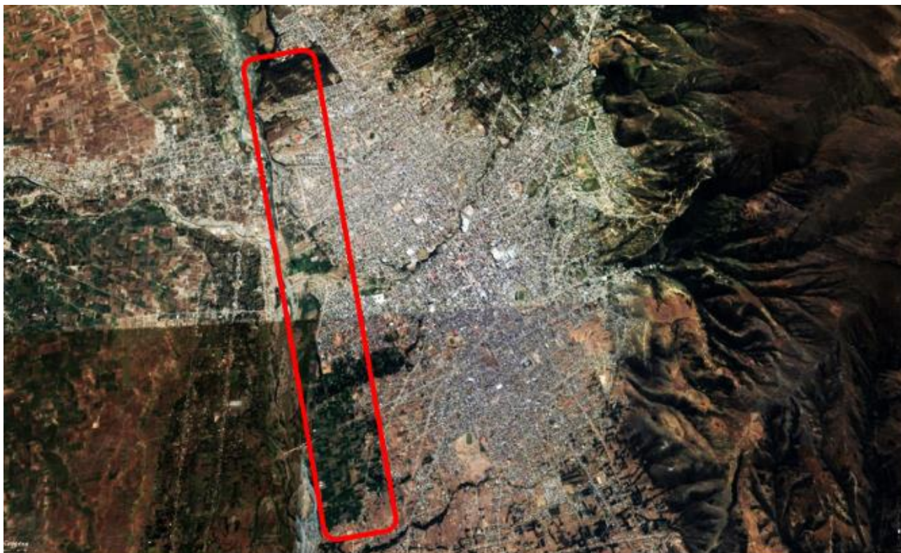
FIGURA 6. Imagen satelital de la ciudad de Huancayo, año 2016