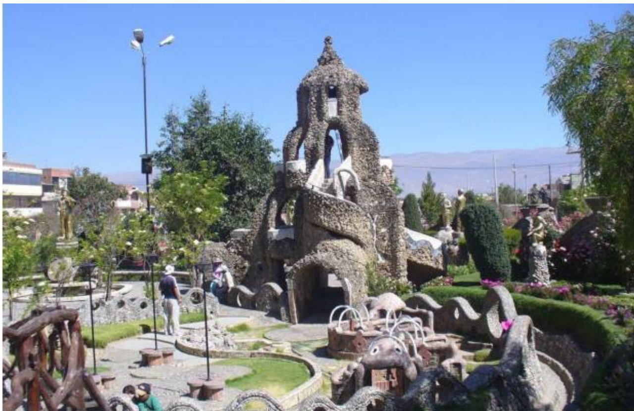
FIGURA 1. Parque de la Identidad Huanca